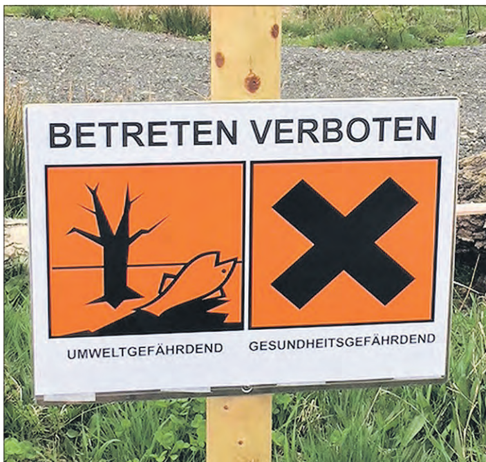
Schilder verbieten das Betreten des Dethlinger Teiches und seines Umfeldes.

Es wurden Warnschilder am ehemaligen Teichrand aufgestellt. „Die Beprobungsarbeiten werden nach einer erneuten nochmaligen intensiven Belehrung der dort arbeitenden Personen in Kürze fortgesetzt“, kündigt der Landkreis an.