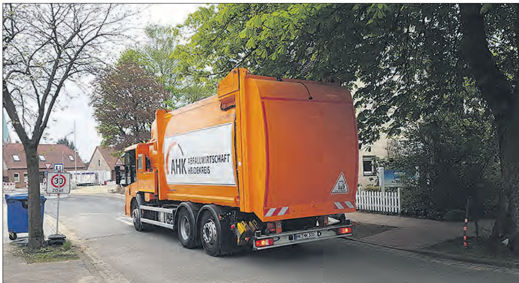
Wenn tonnenschwere Müllfahrzeuge rückwärts fahren müssen, steigt das Unfallrisiko. Die Abfallwirtschaft Heidekreis setzt derzeit eine Reihe von Maßnahmen um, um die Gefahren zu minimieren.