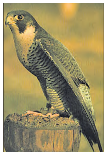
Vom 1. Mai an können Besucher Greifvögel wie den Wanderfalken wieder hautnah erleben.