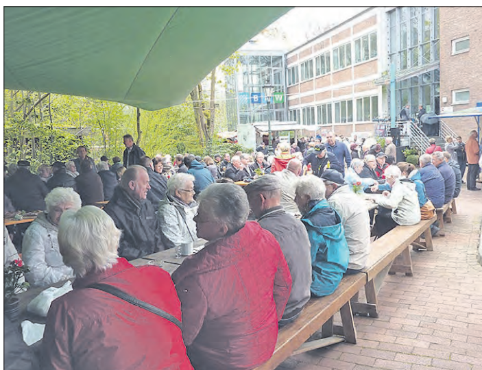
Auch in diesem Jahr hoffen die Veranstalter rund um den Soltauer Salzsiederverein auf möglichst viele Besucher.

Wieder Veranstaltung am 1. Mai in Soltau