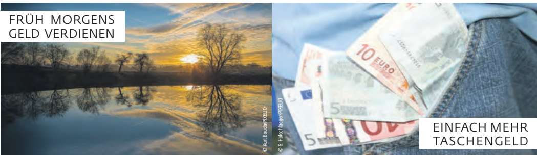
FRÜH MORGENS GELD VERDIENEN