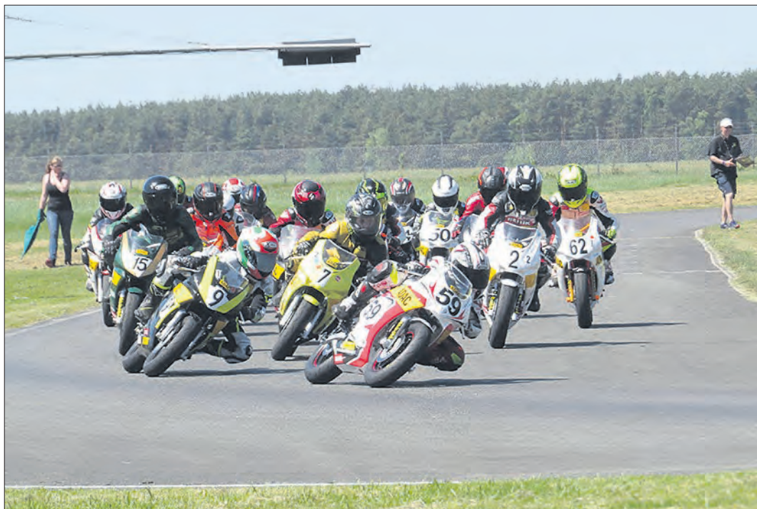
32 Fahrerinnen und Fahrer aus fünf Nationen liefern sich am 11. und 12. Mai in Faßberg spannende Rennen.

Insgesamt 20 Fahrerinnen und Fahrer hatten sich Anfang des Jahres in die Nennliste eingetragen. Startberechtigt sind die Jahrgänge 2008 bis 2012. Die Veranstaltung beginnt am Freitag mit dem „Freien Training“. Am Samstag gibt es zunächst freie Trainingsstunden und Zeittrainings, bevor am Nachmittag die einzelnen Wertungsläufe gestar-