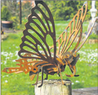
Schmetterlingsskulptur von Friedhelm Röttgers.