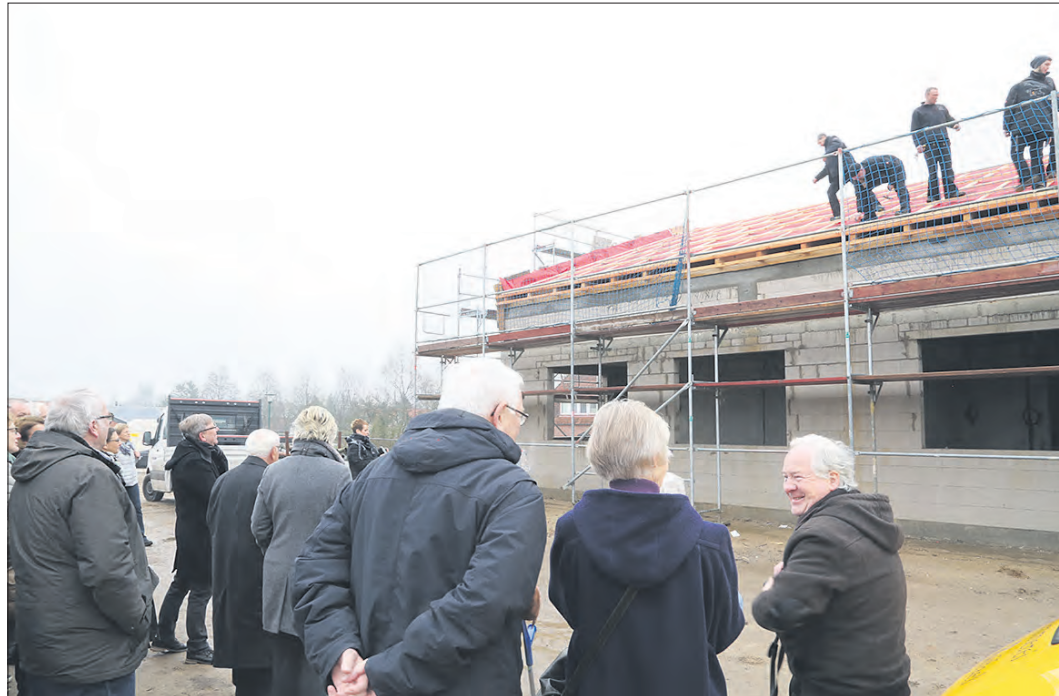
Zahlreiche Besucher und Gäste kamen am vergangenen Freitag zum Richtfest nach Dorfmark.

Dort entsteht auf dem rund 6.500 Quadratmeter großen Gelände zwischen Westendorfer Straße, Koppelweg und Kleines Moor der Neubau in L-Form: „Es wird insgesamt acht Gästezimmer und ein Angehörigenzimmer geben“, erklärt Adari. Geplant seien zudem ein Aufenthalts-/Wohnbereich sowie eine Küche. Zentrales Element der Einrichtung soll der „Raum der Stille“ werden, der als multifunktionaler Bereich zum Beispiel für Andachten genutzt werden kann. Die acht Räume, in denen Menschen in ihrer letzten Lebens-