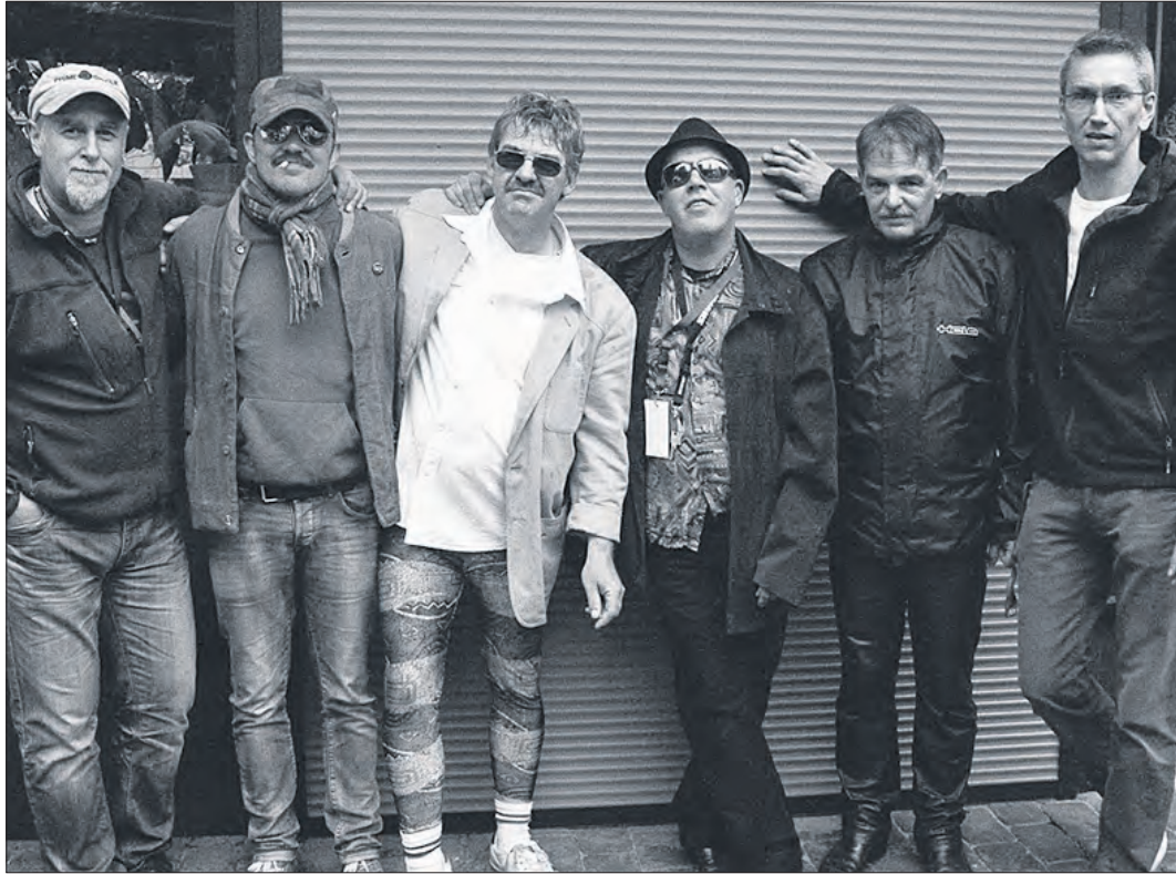
Steht bei der NDW-Party am 3. Februar im Soltauer Band-Center auf der Bühne: Die Band „Elsa Hell“.

Sven-Christian Kindler wieder im Haushaltsausschuß