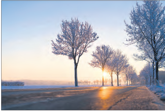
Die Sonne blendet in den Wintermonaten besonders stark.

Eine verschmutzte Windschutzscheibe erhöht die Blendwirkung zusätzlich. Leser rät Autofahrern daher, gerade in der kalten Jahreszeit die Frontscheibe regelmäßig von außen und innen zu reinigen.