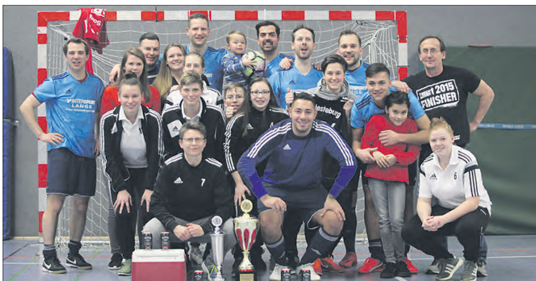
Siegerehrung nach spannenden Spielen. Das Herrenturnier gewannen die Eggers-Allstars, das Frauenturnier entschied der VfL Jestedburg für sich.