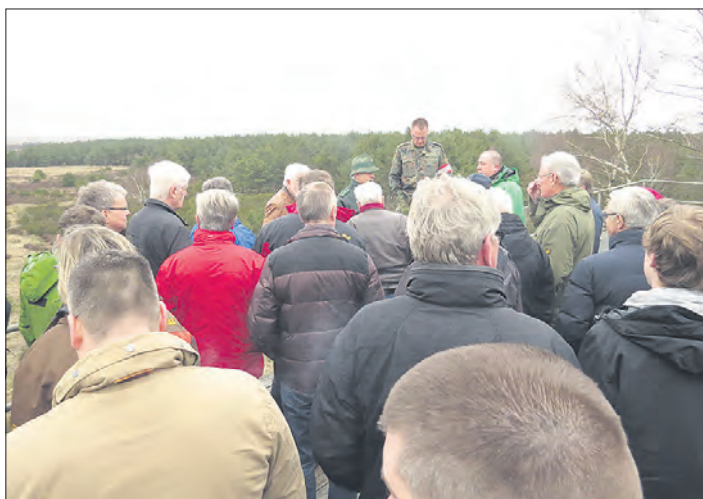
Auch in diesem Jahr bietet die Munster-Touristik wieder Fahrten über die Truppenübungsplätze an.

chen in einer örtlichen Gastronomie ein und kann gemeinsam das Gesehene Revue passieren lassen. Dabei ist dann auch eine Mitarbeiterin der Munster-Touristik anwesend, um alle aufkommenden Fragen zu beantworten. Neben den beschriebenen Touren gibt es auch wieder zwei erweiterte Fahrten mit einem Besuch im Ausbildungszentrum der Bundeswehr. Diese Fahrten stehen am 28. März und 1. August dieses Jahres auf dem Plan und beginnen bereits um 9.30 Uhr. Nach dem Besuch in der Kaserne geht es zum gemeinsamen Erbseneintopf-Essen, bevor die rund dreistündige Rundfahrt beginnt. Auch hier ist während des Essens eine Mitarbeiterin der Munster-Touristik dabei. Die Teilnehmer müssen mindestens 14 Jahre alt sein, Tiere dürfen nicht mitgenommen werden. Eine Anmeldung zu den Fahrten ist ab sofort möglich und zwingend nötig. Anmeldungen werden von der Munster-Touristik, Veestheweg 5, Telefonnummer (05192) 89980, entgegengenommen.