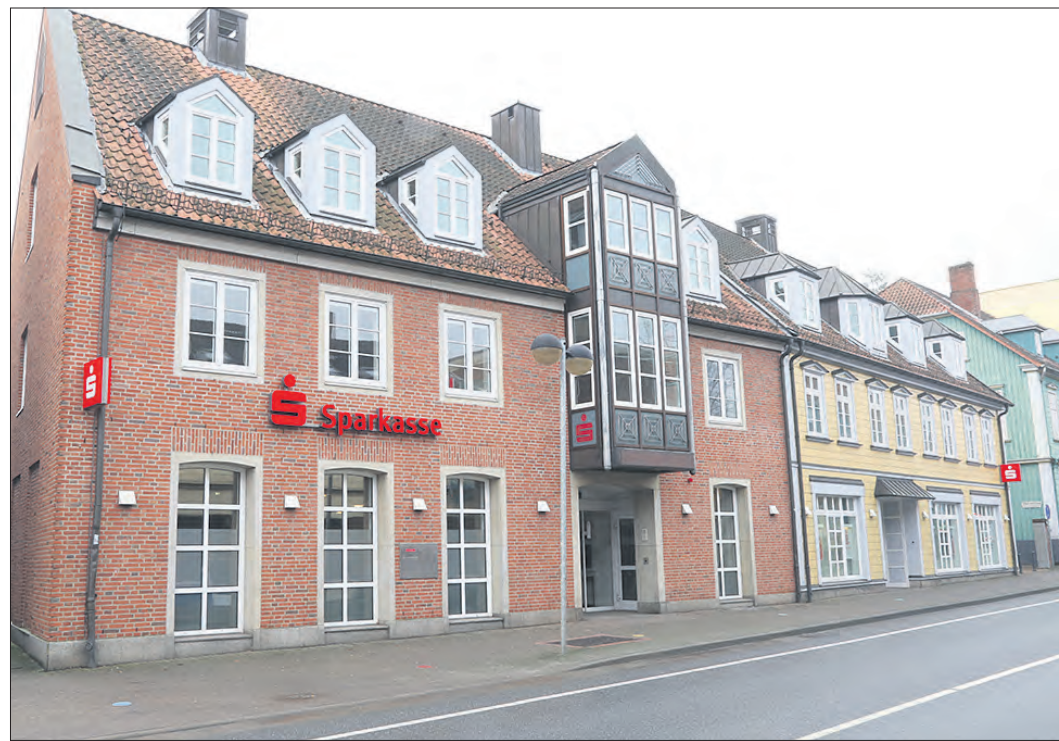
In einigen Monaten wird die Kreissparkasse ihre Filiale Stadtmitte in der Soltauer Poststraße (Foto) schließen. Das Erdgeschoß soll dann vermietet werden.

Und weiter: „Vier Geschäftsstellen unseres heutigen Netzes haben ihre Wurzeln in den 1960er Jahren und sind sozusagen für die Kundenbedürfnisse des vergangenen Jahrhunderts konzipiert worden. Dies gilt insbesondere in Hinblick auf Größe und Ausstattung, die sich damals an ganz anderen Rahmenbedingungen orientierten. In jener Zeit war ‚online‘ ein Fremdwort. Für jede Buchung gab es einen Vordruck, für jede Dienstleistung einen persönlichen Kontakt.“ Dinge, die heute nicht mehr unbedingt erforderlich sind, was wiederum die