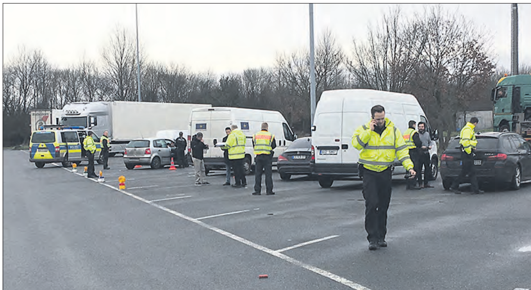
Zahlreiche Beamte waren bei der zweiten „ganzheitlichen Großkontrolle“ der Polizei an der Autobahn 7 beteiligt.

Eine Woche nach der „Premiere“: Polizei setzt Konzept fort