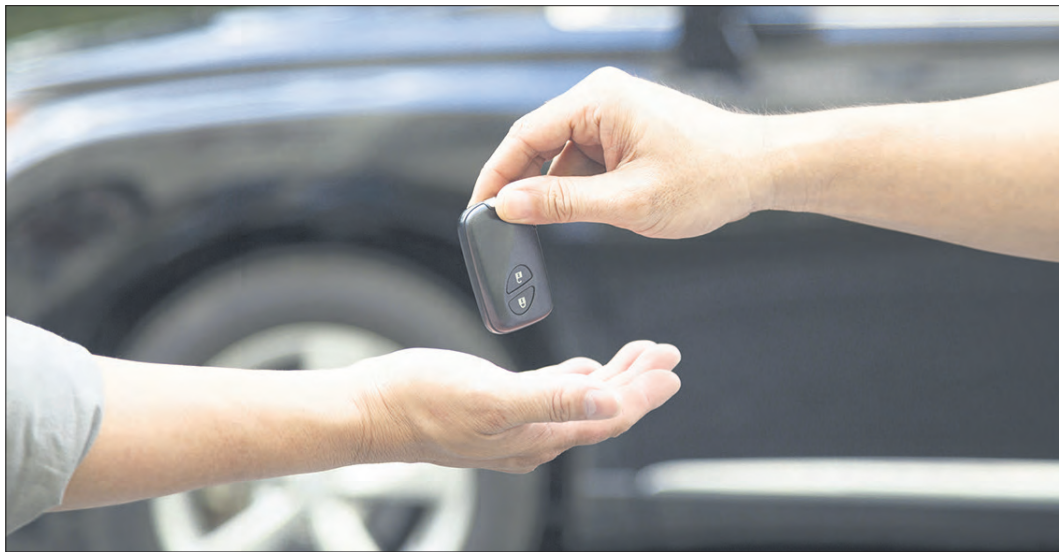
Rund 7,5 Millionen Gebrauchtwagen wechseln pro Jahr in Deutschland laut aktueller Statistik ihren Besitzer.

Etwa 7,5 Millionen Gebrauchtwagen wechseln pro Jahr in Deutschland ihren Besitzer. Möglichst umfangreiche Ausstattung, wenig Kilometer und nur einen Vorbesitzer, so stellt sich manch ein Gebrauchtwagen-