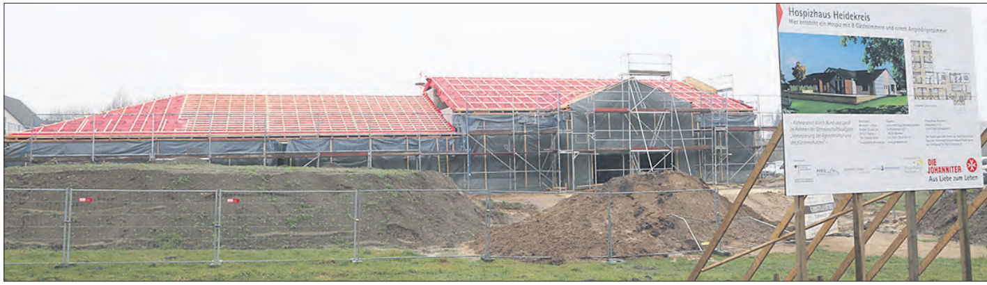
Richtfest auf der Baustelle in Dorfmark: Das Hospizhaus Heidekreis nimmt Formen an und soll bereits im Sommer fertig sein.

Hospizhaus Heidekreis: Richtfest in Dorfmark/Fertigstellung im Sommer